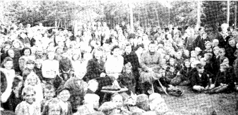
Flygtningene arrangerede selv underholdning på en friluftscene En del af tilskuerne