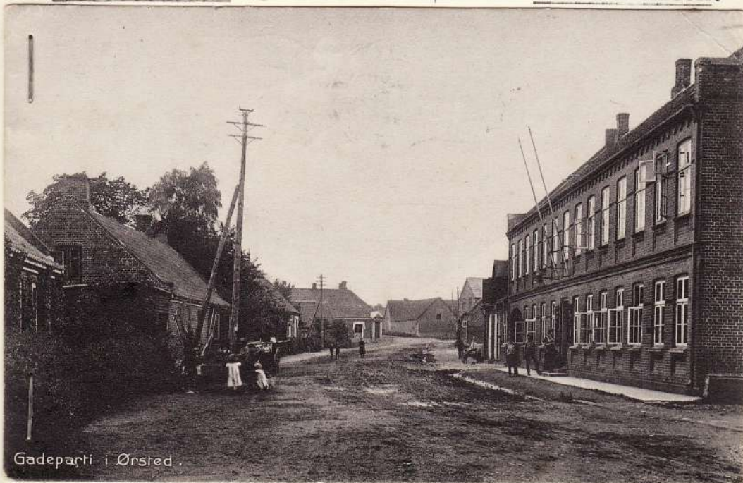
Til venstre: 29b, smedjen 253a, apoteket 227, Polden og 33b. Midt for gården 14a. Til højre: Gæstgivergården 10h, bagerforretningen lom og gavlen af 81.