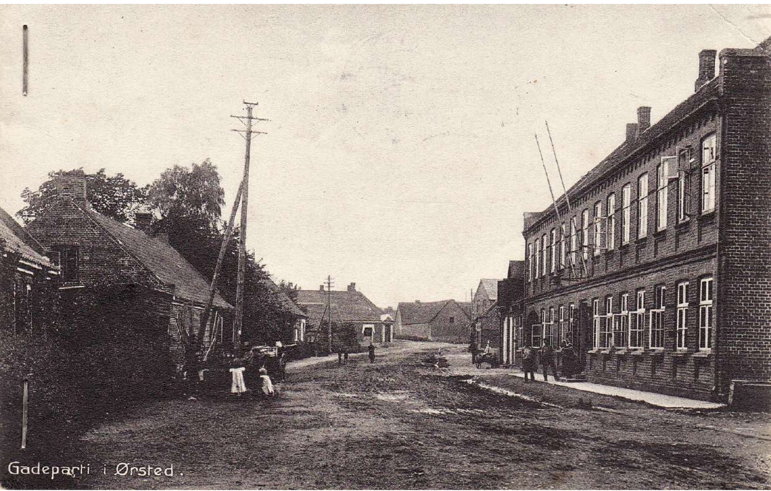
Gadeparti i Ørsted.