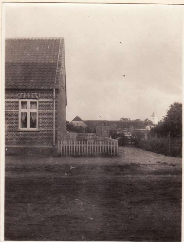
Østsked set fra nord ca. 1935.