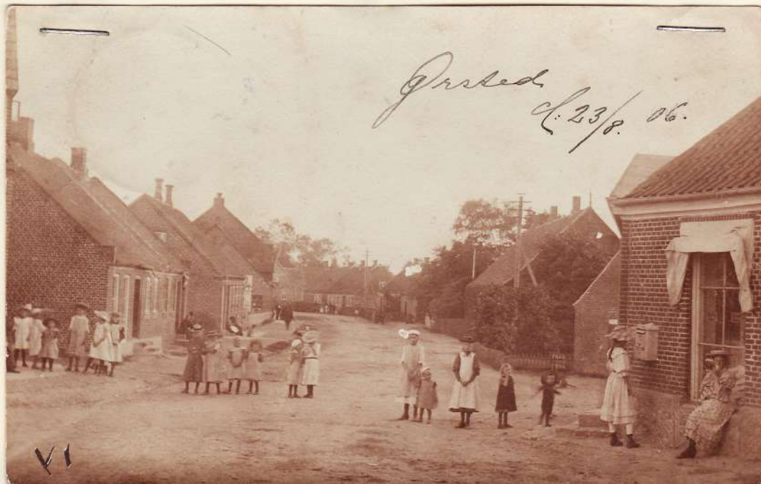
Til venstre ses 80c og 80a, bageriet lom og Gæstgivergården. Til højre: Købmandsforretningen 33b, Polden, apoteket, smedjen, farveriet, 29b og 256.