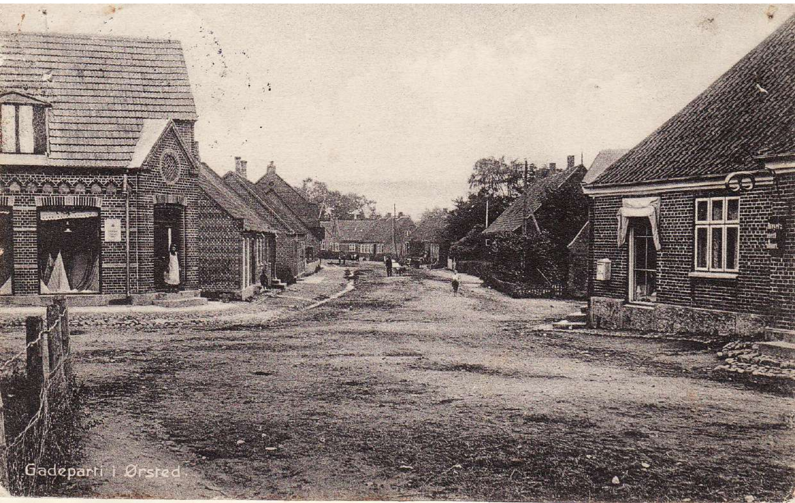
Gadeparti i Ørsted.